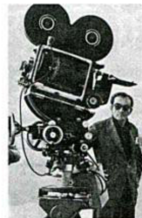
LUCHINO VISCONTI. P.20