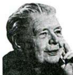
MARGUERITE YOURCENAR P.106