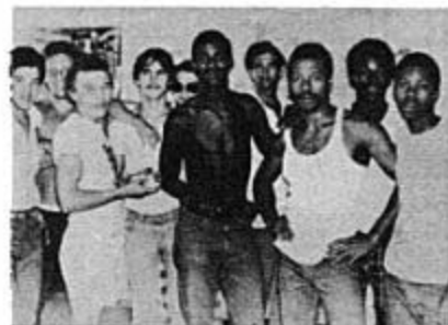
Réfugiés cubains aux États-Unis