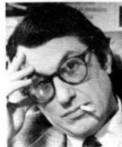
Serge July